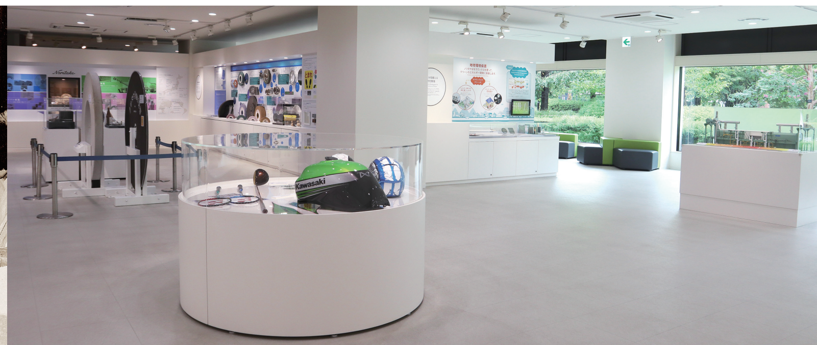
ウェルカムセンター(テクノロジーコーナー)