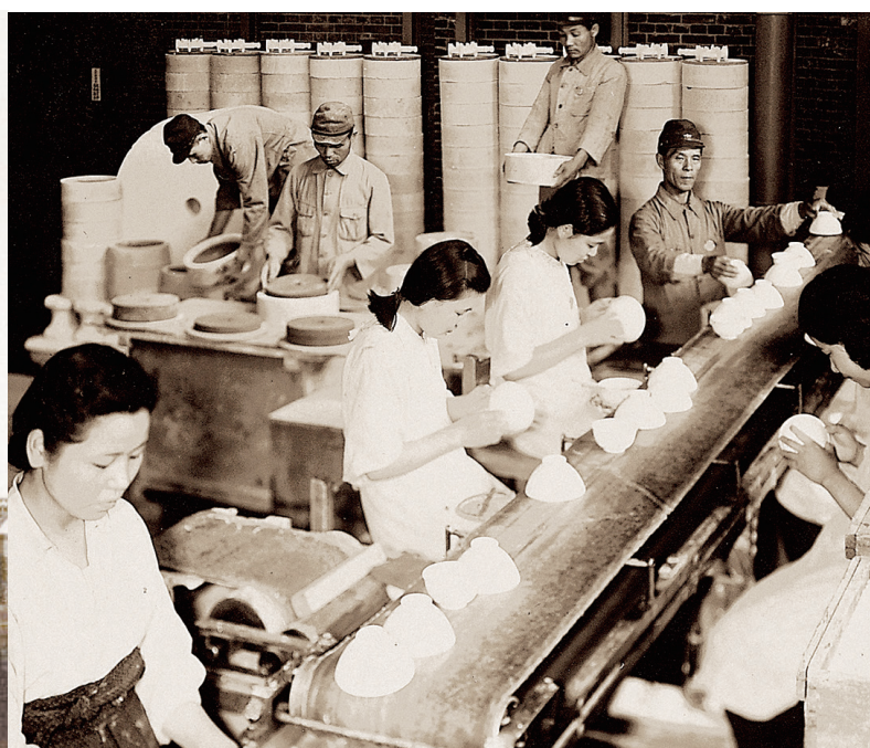
食器と磁石を混焼する焼成工場(昭和15年頃)