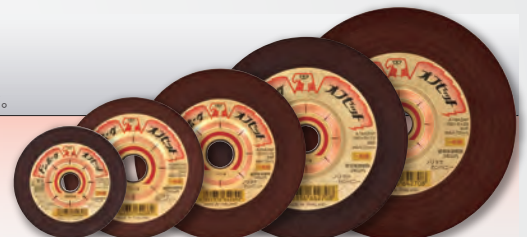
砥石径:φ100 φ125 φ150 φ180 φ205

ドンホークシリーズが初めて発売されてから約半世紀。 その伝統を確実に受け継ぎながら更なる進化を遂げました。