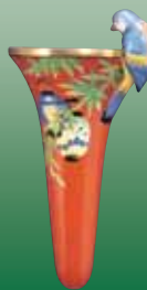
Vase Porcelain H. 8.3in. 1918~1930